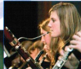
Konzentration & Spaß