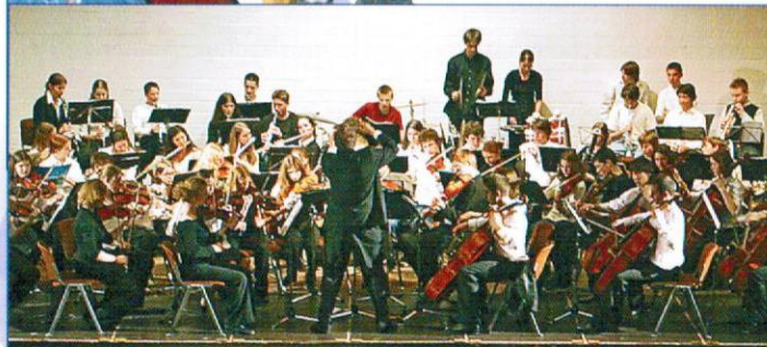
Musik ist im Konzert am Schönsten

© Logo + Gesamtgestaltung: IURST design, 0234 325 888-9