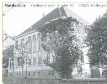
Musikschule Bredenscheider Straße 10 45525 Hattingen